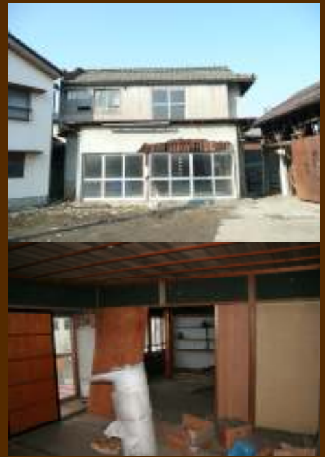
リフォーム前は、こんな状態でした…